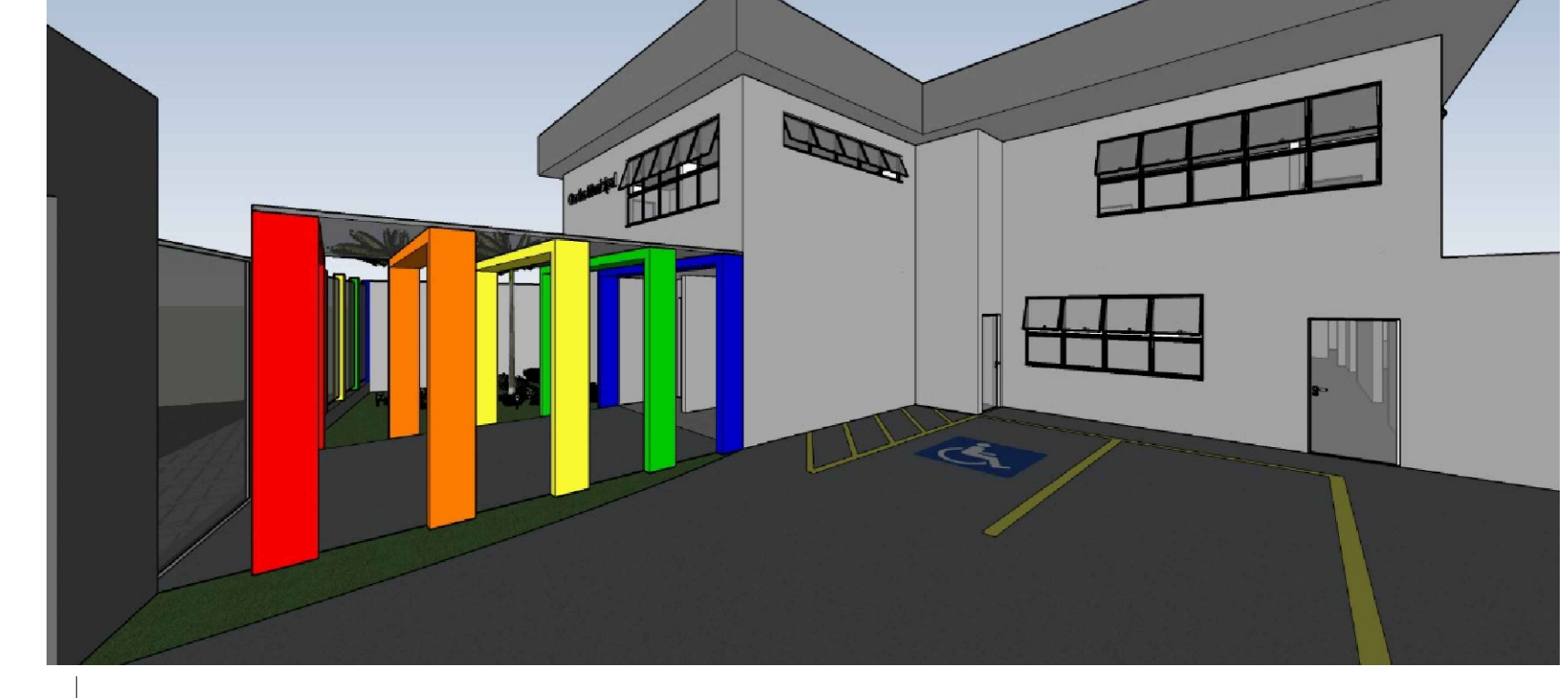
Perspectivas Sem Escala